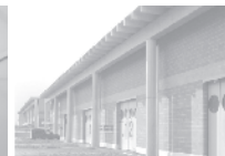
BIC Borgo Valsugana