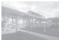
POLO TECNOLOGICO Rovereto