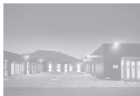
POLO MECCATRONICA Rovereto