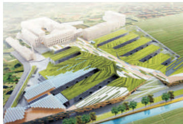
PROGETTO MANIFATTURA Rovereto