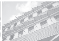
BIC Pergine Valsugana